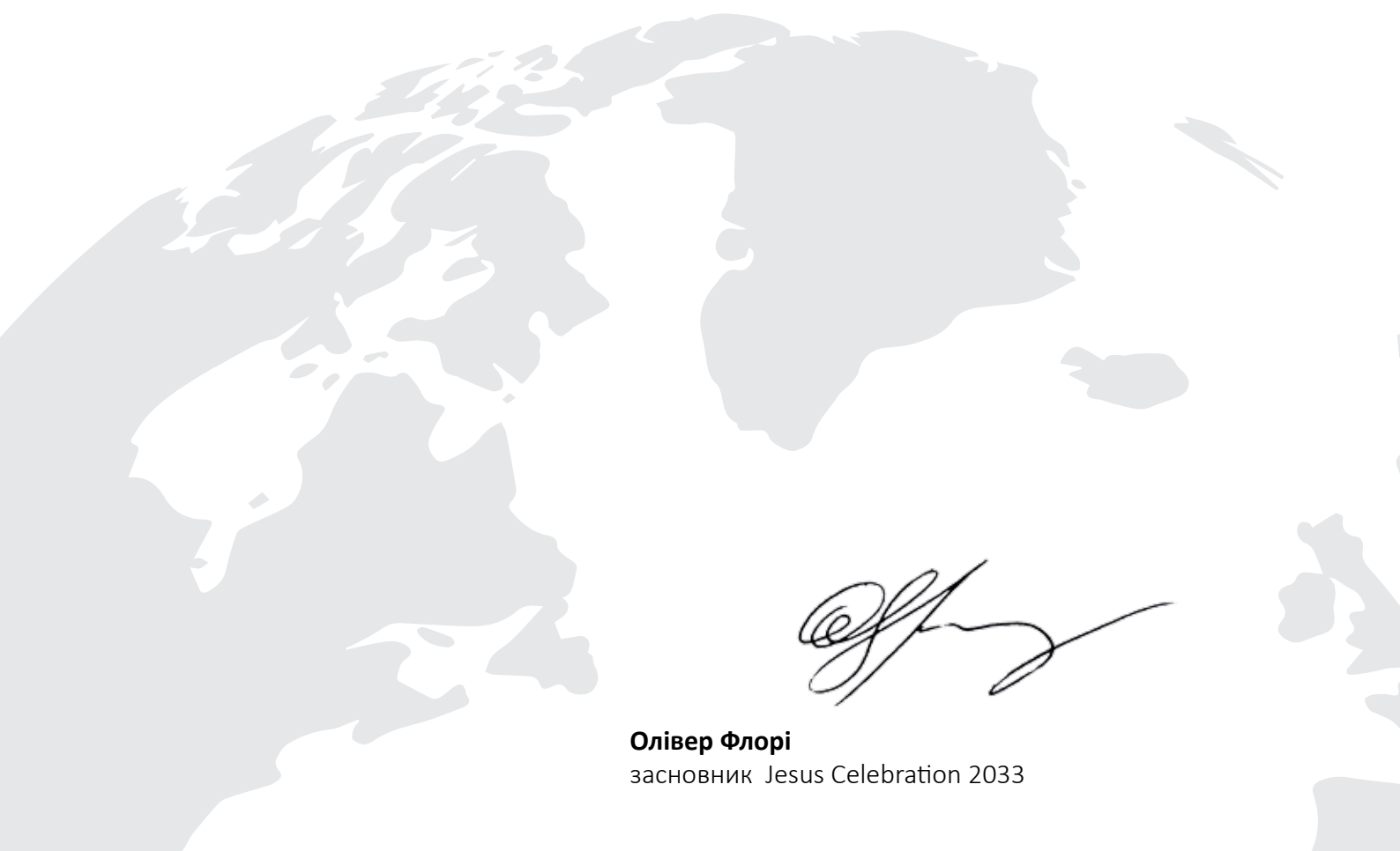
Олівер Флорі засновник Jesus Celebration 2033